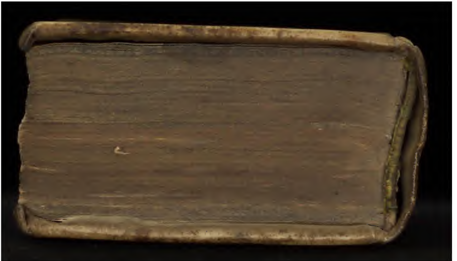
382 M 17 [1]